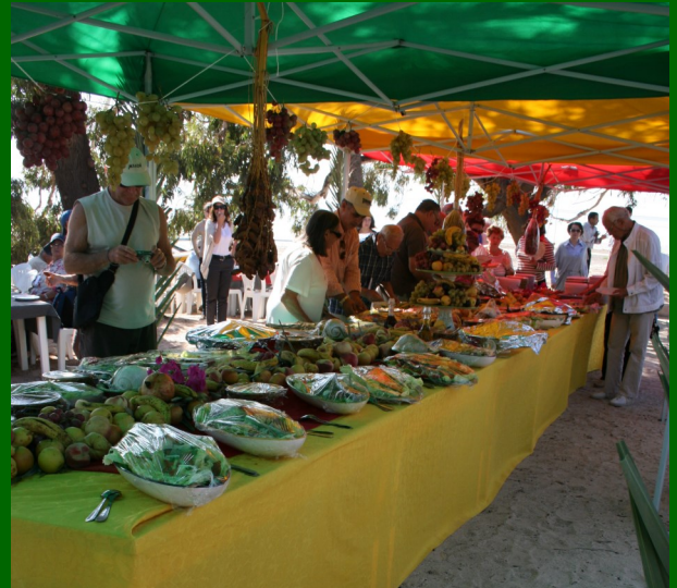
Voyage Tunisie 2008 à Kerkenah Buffet servi sur la plage les pieds dans l'eau