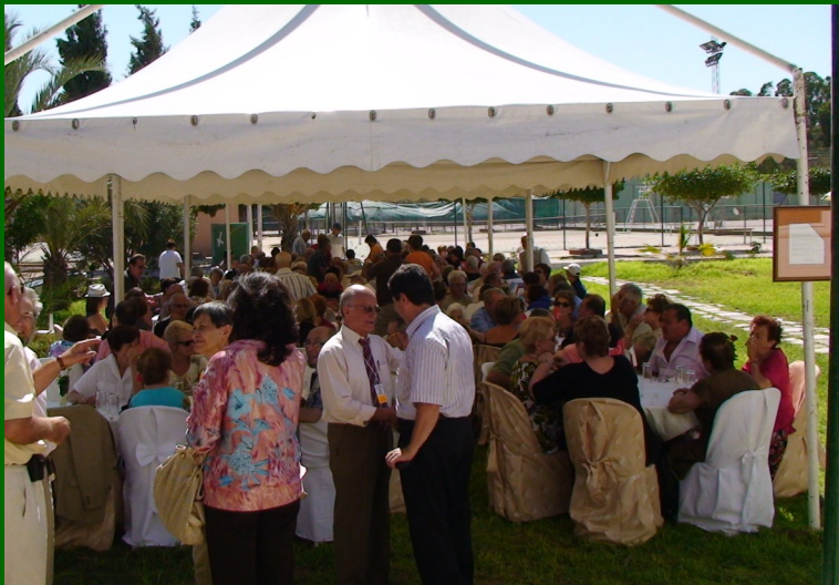
Voyage Tunisie 2008 repas servi sous tente au Tennis club

Nous vous demandons de bien rédiger votre bulletin de renouvellement d'adhésion, surtout l'adresse Mail qui devient presque indispensable par sa rapidité. Que ceux qui n'ont pas de mail se rassurent nous gardons le contact par voie postale