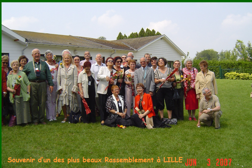
Souvenir d'un des plus beaux Rassemblement à LILLE JUN 3 2007