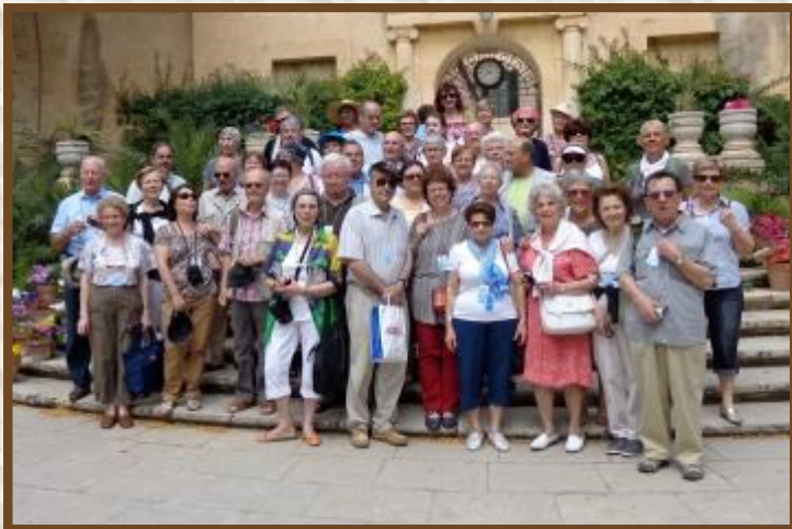
Malte du 02 au 9 juin 2013 Les 47 participants au Jardin de SAN ANTON

Les documents concernant rassemblement et voyage vous seront expédiés par courrier séparé.